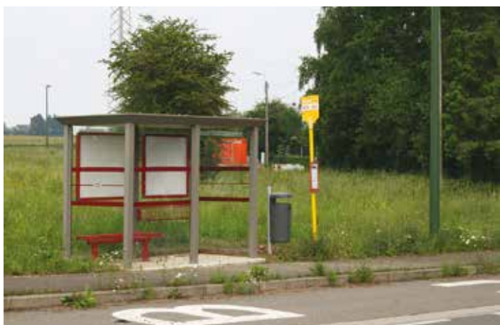
Rond Point N66

Des travaux dans le bâtiment du CPAS sont en cours pour recevoir, au rez-de-chaussée, l'Accueil de la petite enfance : une garderie pour 9 enfants, avec deux gardiennes de l'ONE, qui ouvrira ses portes en septembre prochain.