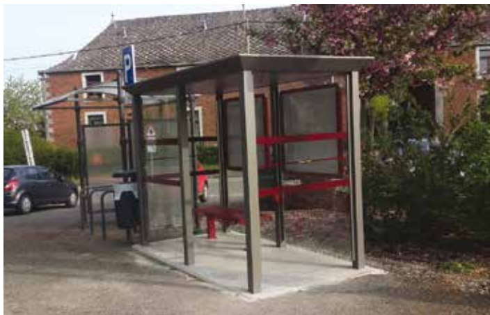
Place de Strée

Comme chaque année, nous avons commandé 2 nouveaux abris bus (avec une participation substantielle du TEC) : cette fois-ci, ce sont deux abris sur la RN 66 Huy-Hamoir qui ont été rénovés : sur le triangle de Strée et au 1er rond-point en arrivant de Huy.